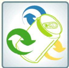
(สัญลักษณ์โครงการ)